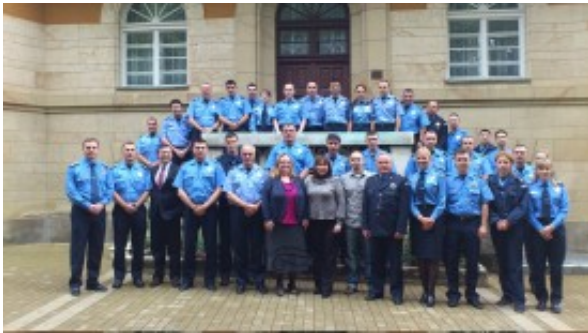
Druga grupa policijskih službenika, fotografija ispred hotela "Promenada" u Vrnjačkoj Banji