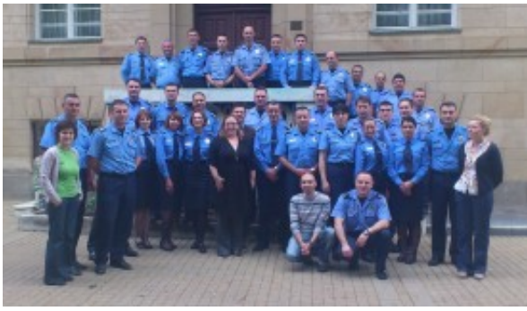
Prva grupa policijskih službenika, fotografija ispred hotela "Promenada" u Vrnjačkoj Banji