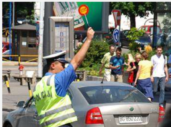
Ko će raditi 12. novembra?

Ipak, jedan od reprezentativnih policijskih sindikata u Srbiji, Policijski sindikat Srbije, neće učestvovati u generalnom štrajku. Prema njihovom saopštenju, za najavljeni štrajk ne postoji nijedan valjan razlog. Štaviše, oni služe za „postizanjem usko-ličnih interesa pojedinih sindikalista koji svojim postupcima propagiraju antisindikalizam“.