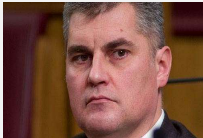
Ivan Brajović, ministar unutrašnjih poslova Crne Gore

U prilog činjenici da policijska saradnja sa Crnom Gorom, koja se često ocenjuje kao saradnja sa najvećim preprekama, ide uzlaznim tokom je i potpisivanje Sporazuma o vanrednim situacijama. Tom prilikom je istaknuto da nijedna zemlja u regionu nema dovoljno kapaciteta da se samostalno bori protiv prirodnih katastrofa i da je saradnja u toj oblasti neophodna. Dačić je istakao da će se tim sporazumom objediniti sva raspoloživa sredstva koja imaju dva ministarstva kako bi posledice prirodnih katastrofa bile manje.