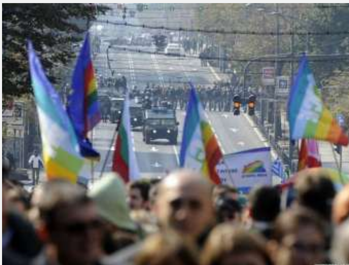
Parada ponosa u Beogradu

Italijanske kompanije ENI, FIAT, ali i u bliskoj budućnosti Finmeccanica, sigurno će igrati značajnu ulogu u Srbiji. Sa investicijama Fijata u Zastava automobile, nekadašnjem državnom preduzeću sa sedištem u Kragujevcu, Srbija bi mogla da proizvodi 200,000 automobila za nekoliko godina sa obimom izvoza od 1,3 milijardi evra, što je skoro 20 odsto izvoza Srbije u 2009. godini. Deset godina nakon pada Slobodana Miloševića, to su neke od dugo očekivanih vesti u državi u kojoj je 30 odsto radne snage nezaposleno i gde plate dostižu polovinu vrednosti kao u današnjoj Poljskoj.