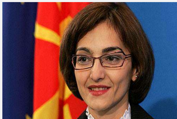
Gordana Jankulovska, ministarka unutrašnjih poslova Makedonije

Ivica Dačić, ministar unutrašnjih poslova je u razgovoru sa makedonskom kolegicom Gordanom Jankulovskom istakao da potpisani sporazum omogućava uspješnu operativnu policijsku saradnju dveju policija. Saradnja je, prema rečima Dačića, veoma uspešna i da bi trebalo da predstavlja jaku motornu snagu za podsticanje saradnje i u drugim oblastima.