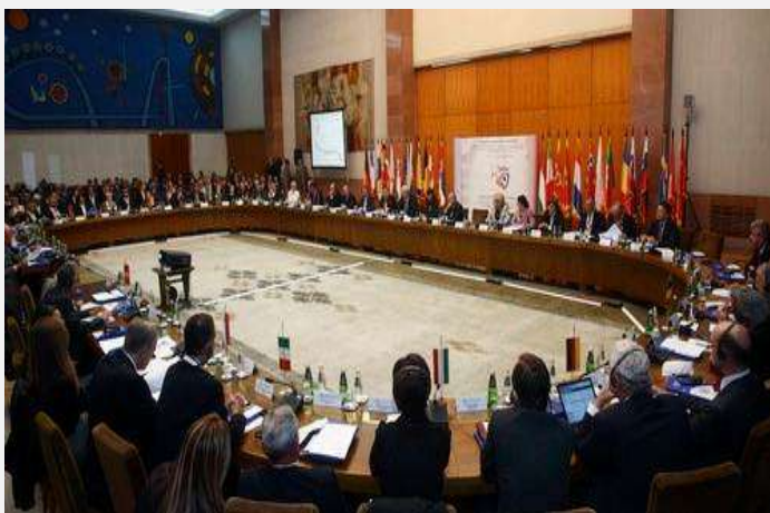
Pogled na konferenciju u Beogradu

Posle sastanka u septembru započeti su završni razgovori o potpisivanju Sporazuma o readmisiji sa Makedonijom, odnosno vraćanju lica koja nezakonito borave na teritoriji obe države. Razgovori su protekli uspešno, obzirom da je na konferenciji „Jačanje regionalne i transnacionalne saradnje kao preduslov za uspešnu borbu protiv organizovanog kriminala na području jugoistočne Evrope“ početkom oktobra u Beogradu taj sporazum i potpisan. Trenutno je Albanija jedina država u regionu sa kojom Srbija nije uredila proces readmisije.