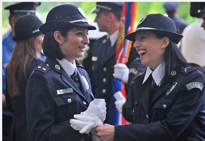
Žene policajci u Srbiji

su kampanje za regrutovanje i prijem žena u policijsku službu neujednačene i nesistematske, odnosno da ne postoji strateški pristup prijemu žena (utvrđivanje kvota za prijem žena, godišnji ciljevi za regrutovanje određenog broja žena i muškaraca, vremenski rok do koga treba postići određeni procenat žena u policijskoj službi i sl.).