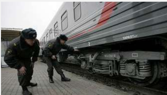
Ruski policajci na dužnosti

Po rečima Kosalsa, ruski policijski sistem je „snažno“ centralizovan gde „reč vrhovnog“ vredi više nego slovo zakona. To je rezultat nasleđa iz prošlosti, a pre svega sistema koji je postojao za vreme Narodnog komesarijata za unutrašnje poslove (NKVD), četrdesetih i pedesetih godina XX veka. Pored toga, ne postoje javno dostupne i pouzdane informacije o broju ili trenutnim aktivnostima ruske policije. Poslednji izveštaj o broju policajaca u Rusiji predstavljen je u UN 1994. godine, a statističke analize o krivičnim delima prestale su sa objavljivanjem nakon Putinovog dolaska na vlast 2000. godine. Autor navodi, oslanjajući se na izveštaj Fonda za otvoreno društvo, činjenicu koja posebno zabrinjava da je 49 odsto policijskih službenika prijavilo rad nakon, a 18 odsto za vreme radnog vremena.