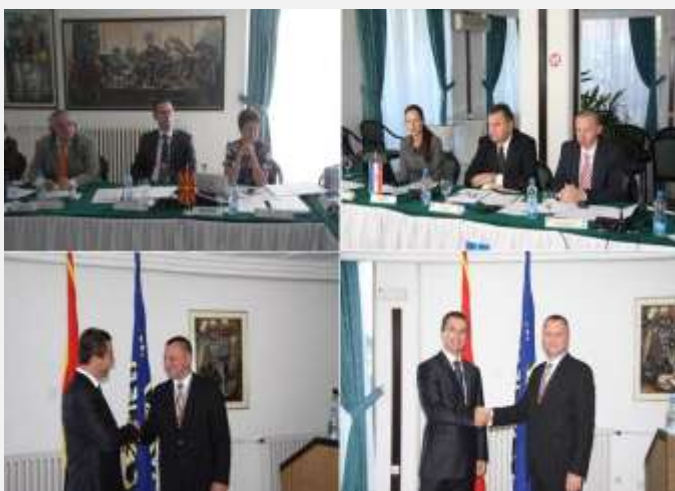
Na sastanku u Ohridu

Ljupčo Todorovski, makedonski direktor policije postao je novi predsednik Asocijacije. Na sastanku u Ohridu u septembru ove godine, kada je Makedonija zvanično preuzela ulogu predsedavajućeg, predstavljani su glavni problemi i budući ciljevi policija u JIE. Todorovski je istakao svoju spremnost sa ciljem stvaranja efikasnog sistema regionalne policijske saradnje u borbi protiv organizovanog kriminala. Kao predsedavajući, Makedonija će raditi na 16 različitih projekata od kojih je većina posvećena razbijanju organizovanih kriminalnih grupa i stvaranju kvalitetnih kriterijuma policijskog rada. Glavna ideja je da se formira operativni policijskih mehanizam na nivou regiona koji će raditi na suzbijanju kriminalnih aktivnosti u regionu.