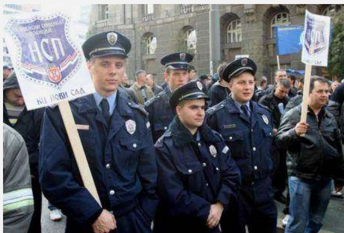
Članovi Nezavisnog sindikata policije na protestu

Pre nešto više od dve godine (25. oktobra 2008. godine) pripadnici brigade policijske uprave Beograda odbili su da izađu na teren zbog „prevelikog angažovanja i iscrpljenosti“, kako su naveli. Tom prilikom, Ivica Dačić, ministar unutrašnjih poslova Srbije izjavio je da bi trebalo otvoreno razgovorati o svemu i „da ćemo se generalno boriti za poboljšanje statusa policajaca“. Dve godine kasnije učinjena su dva koraka za poboljšanje ekonomskog i socijalnog statusa policijskih službenika. O pozitivnom ili negativnom karakteru tih akcija teško je govoriti, s obzirom na trenutni nesklad koji postoji između policijskih sindikata, naročito između dva reprezentativna.