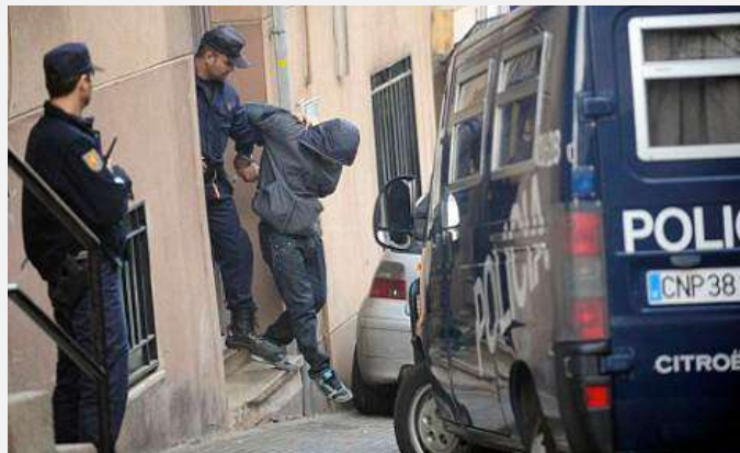
Španska policija privodi osumnjičenog za teroristički napad u Madridu 2004. godine

podatke o identitetu počinioca te mesto i vreme učinjenog napada.