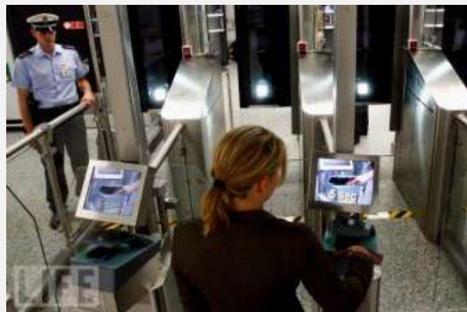
Nemačka policija testira novi biometrijski način kontrole granica — „easypass“

osnova za vremenski okvir i budžetske troškove koji su predstavljeni u izveštaju.