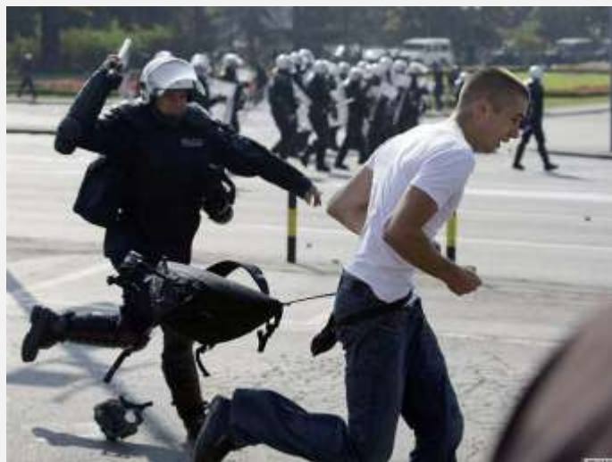
Policija rasteruje demonstrante protiv Parade ponosa

Nema sumnje da ovaj slogan, naznačen velikim slovima na zidovima Beograda i poprskan kapljicama crvene farbe, nije izmakao pažnji Hilari Klinton 12. oktobra ove godine. Tada je državna sekretarka po prvi put prelazila most preko reke Save na ušću u Dunav i Panonsku regiju na granici Balkana. Natpisi na zidu nisu bili prazna priča jer je u nedelju grupa srpskih ultra-desničara i huligana — koja deli slične ideje sa počiniocima nereda na stadionu u Đenovi — opustošila prestonicu u znak protesta protiv Parade ponosa. Katastrofalan pokazatelj netolerancije u zemlji čija je kandidatura za pristupanje EU na dnevnom redu evropske dvadesetsetdvorice 25. oktobra.