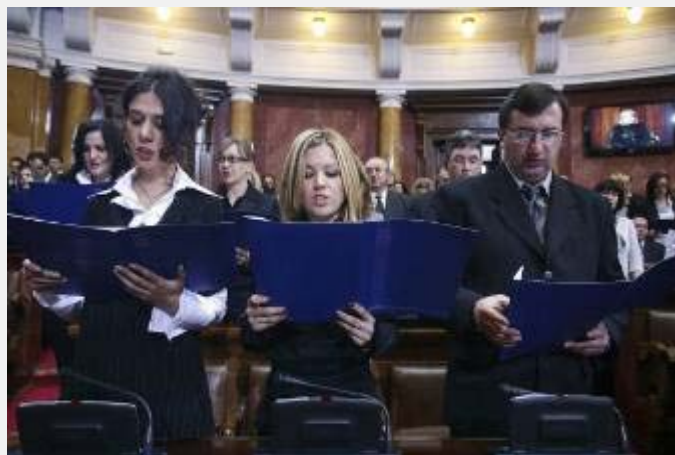
Sudije i zamenci tužilaca položili zakletvu

U kontekstu demokratizacije, reforme institucija i evropskih integracija u Srbiji ključna su dva događaja u 2009. godini. Oba su se odigrala u mesecu decembru, jedan „na brzinu“, drugi „sa mukom“. Reč je o 16. decembru 2009. godine kada je Visoki savet sudstva doneo odluku o izboru sudija na stalnu funkciju u sudovima opšte i posebne nadležnosti. Drugi važan događaj bio je 19. decembar 2009. godine kada je Srbija pristupila tzv. beloj (pozitivnoj) šengenskoj listi.