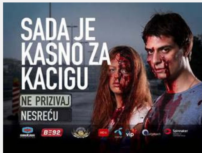
Kampanja „Ne prizivaj nesreću“

U ovom tekstu nećemo ulaziti u dublju raspravu o konkretnim rešenjima novog Zakona. Neka od njih su sasvim opravdana poput zabrane korišćenja mobilnih telefona tokom vožnje ili zatvorske kazne za nasilničku vožnju. Ima i onih odredbi koje uvode veoma rigorozne kazne za pojedine prekršaje koje se teško mogu objasniti. Tako za neposedovanje svetloodbojnog prsluka, vožnju bez upaljenih oborenih svetala ili prelazak pešačkog prelaza tokom razgovora mobilnim telefonom propisana je najniža kazna koju ovaj Zakon propisuje – tri hiljade dinara.