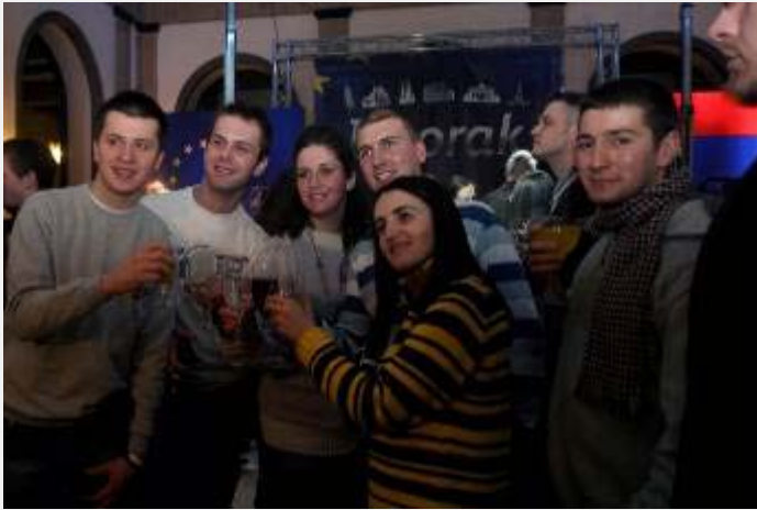
Karavan „Evropa za sve“ nakon povratka u Srbiju

policije, tužilaštva i sudstva. Jedino tako možemo dobiti „bitku“ protiv organizovanog kriminala.