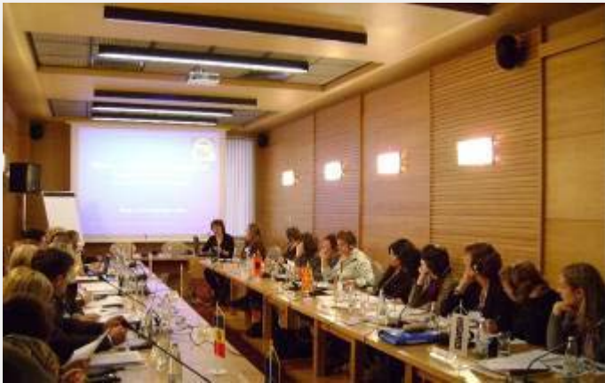
Treći sastanak WPON u Sofiji

nica zemalja Jugoistočne Evrope (Southeast Europe Women Police Officers Network, WPON), trećim sastankom u Sofiji, decembra 2009. godine. Na sastanku su učestvovalе policijske delegacije iz Albanije, Bosne i Hercegovine, Makedonije, Moldavije, Rumunije i Srbije. Na dnevnom redu trećeg sastanka radne grupe bila je izrada osnovnih elemenata i principa budućeg statuta organizacije. Posebno je bilo reči o organizacionoj strukturi WPON, problemu članstva, glavnim oblastima delanja, kao i sa saradnja sa međunarodnim organizacijama. Najvažniji ishod sastanka u Sofiji je izrada detaljnog plana rada svih zainteresovanih strana, odluka o stvaranju privremenog upravnog odbora, koji će biti imenovan u februaru 2010. godine. Glavni zadatak odbora je izrada statuta organizacije.