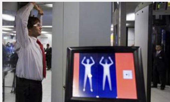
Skener na aerodromu Šipo u Holandiji

Ovaj događaj potpuno je uzbunio bezbednosne krugove unutar SAD i doveo do preispitivanja i jačanja dosadašnjih mera bezbednosti na američkim aerodromima. U sklopu tih mera administracija predsednika Obame najavila je postavljanje ukupno 450 skenera nove generacije (pored već postojećih 40) koji skeniraju celo telo. Ova mera nije, međutim naišla na odobravanje svih država članica EU. Samo Holandija i Velika Britanija su već postavile takve mašine, dok Francuska i Italija planiraju da pre nego što odobre uvođenje naprave studiju njihove efikasnosti. Nemačka i Finska se protive uvođenju ovakvih naprava.