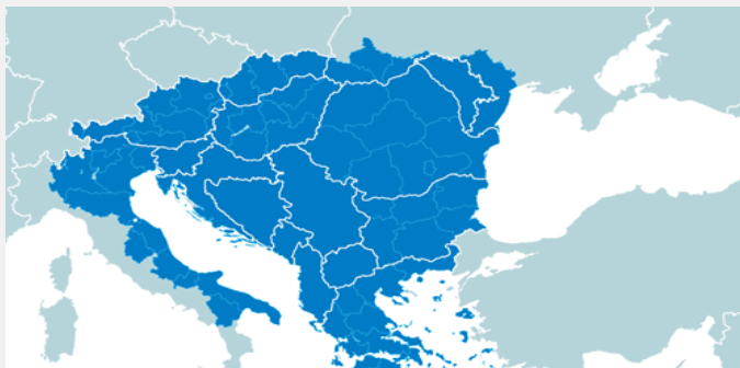
Mapa Jugoistočne Evrope

U decembru 2009. godine, povodom obeležavanja deset godina postojanja Regionalnog centra za borbu protiv prekograničnog kriminala Inicijative za saradnju u Jugoistočnoj Evropi (SECI centar), potpisana je Konvencija o osnivanju Centra za sprovođenje zakona u Jugoistočnoj Evropi (Convention on Southeast European Law Enforcement Centre, SELEC). Ovom konvencijom zamenjen je osnivački SECI Ugovor, a nekadašnje članice SECI, potpisnice Konvencije, postale su automatski članice novog centra. Republika Srbija je od 2001. godine potpisnica Ugovora o saradnji u sprečavanju i suzbijanju prekograničnog kriminala i Povelje o organizaciji i delovanju Inicijative za saradnju u Jugoistočnoj Evropi.