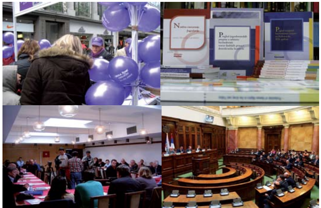
Aktivnosti Evropskog pokreta u Srbiji i Centra za civilno-vojne odnose

ASTRA-Anti Trafficking Action, www.astra.org.yu Evropski pokret u Srbiji, www.emins.org ISAC fond www.isac-fund.org Beogradski centar za ljudska prava, www.bgcentar.org.yu