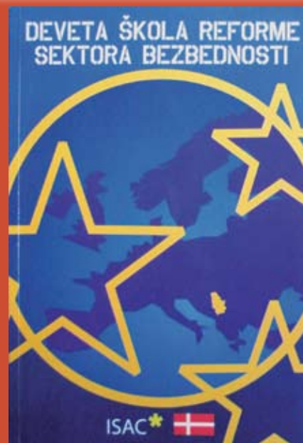
Naslovna stranica Zbornika radova Devete škole reforme sektora bezbednosti koji je izdao ISAC fond

S obzirom na to da u organizacijama civilnog društva postoji ekspertiza, one imaju veoma važnu ulogu u obrazovanju, tj. u sticanju novih znanja o bezbednosnim temama. Do sada su organizacije civilnog društva organizovale raznovrsne programe obuke, počev od jednostavnih seminara za predstavnike onih ministarstava koja su deo sektora bezbednosti, pa do specijalističkih studija na Univerzitetu u Beogradu čiji su polaznici bili predstavnici sektora bezbednosti. Publikacije OCD nekada određene teme prvi put predstavljaju na sveobuhvatan način. Tako priručnik ISAC fonda pod