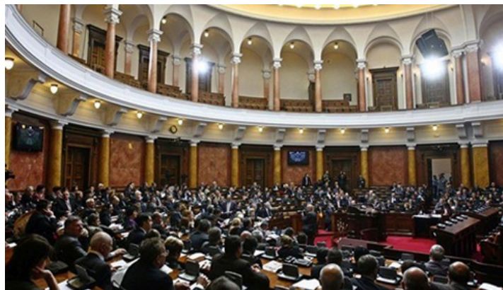
Javno slušanje u Domu Narodne skupštine o Nacrtu izmena zakona o izboru narodnih poslanika, RTS

lozima zakona. Veće učešće građana, zainteresovanih grupa i javnosti unapređuje postupak usvajanja zakona i demokratičnost parlamenta, ali i društva u celini.