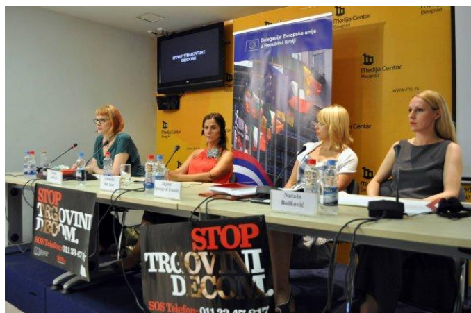
Prezentacija izveštaja

žrtve (povratak u školu, stanovanje uz podršku, pomoć u pronalaženju posla, obnavljanje porodičnih i socijalnih mreža, regulisanje statusnih pitanja i sl.). Republika Srbija je 14. aprila 2009. godine ratifikovala Konvenciju Saveta Evrope za borbu protiv trgovine ljudima, koja trgovinu ljudima posmatra pre svega kao kršenje ljudskih prava i povredu dostojanstva i integriteta ljudskih bića. Osim što ratifikacija za sobom povlači određene obaveze, pre svega u smislu obezbeđivanja i unapređenja standarda zaštite žrtava trgovine ljudima i njihovih prava – zaštitu privatnosti, pomoć žrtvama, vreme za oporavak i razmišljanje, naknadu štete i pravnu zaštitu i dr, Republika Srbija se na ovaj način saglasila i da praćenje i izveštavanje o sprovođenju ove konvencije na njenoj teritoriji vrši grupa eksperata za suzbijanje trgovine ljudima – GRETA. Proces praćenja treće grupe država među koje spada i Srbija počinje u februaru 2012. godine, dok se konačni izveštaj i preporuke očekuju u drugoj polovini 2013. godine.