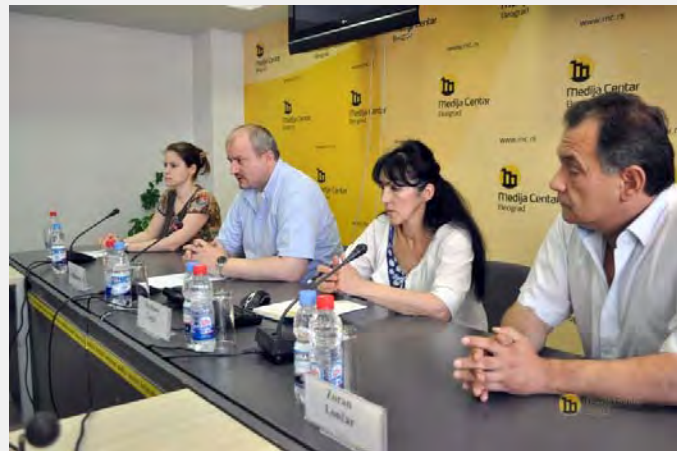
Konferencija u Medija centru