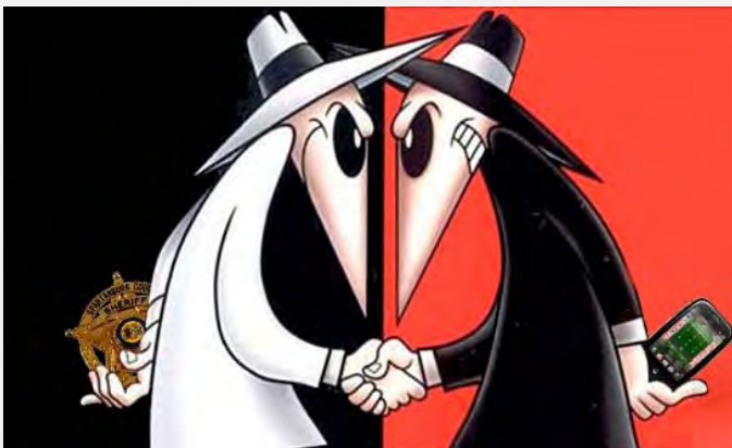
Elektronsko prisluškivanje

Ovde se javljaju dva problema. Najpre, telo za zaštitu tajnih podataka u Srbiji ne postoji, već su svi organi dužni da štite tajne podatke koje u svom posedu imaju. Zagovornici Predloga zakona pak tvrde da je Kancelarija Saveta za nacionalnu bezbednost nadležno telo za nadzor nad sprovođenjem Zakona o tajnosti podataka, a ne za zaštitu tajnosti podataka. A prema Zakonu o tajnosti podataka isti posao pored Kancelarije obavlja i Ministarstvo pravosuđa. Iz toga proizilazi da ako jedinstveno telo za zaštitu podataka ne postoji, nema ni nadzora nad zadržanim podacima, odnosno obrađivači podataka bi kontrolisali sami sebe. Drugi problem je taj što je ovako nejasnom formulacijom Poverenik praktično onemogućen da nadzire zadržane, odnosno dostavljene podatke.