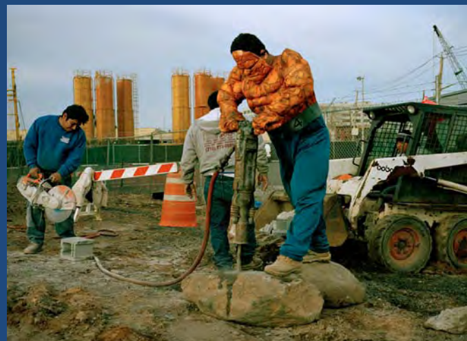
„Stvar“ kao „fantastični migrant“ ( Foreign Policy )

Kako bi finansirala svoj boravak na studijama, Dulse je u Njujorku ilegalno radila kao konobarica i bejbisiterka. U međuvremenu, predavala je engleski jezik i čak pružala pravne savete drugim imigrantima iz Meksika. Stekla je značajno iskustvo, koje sama sumira rečima „latino radnici u Njujorku su skriveni u kuhinjama, tuđim kućama. Najveći deo izveštavanja medija u SAD sadrži tužnu sliku migranata koji nastoje da pređu granicu. Lako je zanemariti njihov doprinos američkom društvu i ekonomiji.“