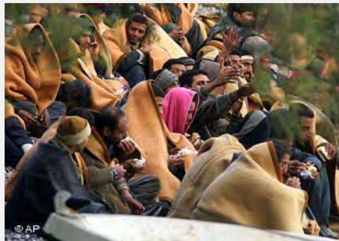
Ilegalni migranti kroz Tursku u EU

Ekonomska kriza i snažnije kontrole granica glavni su razlozi pada broja ilegalnih imigranata koji dolaze u EU, saopštila je Evropska agencija za upravljanje operativnom saradnjom na spoljnim granicama država članica (FRONTEX). Ukupno je pronađeno 106.200 ilegalnih imigranata na evropskim morskim i kopnenim granicama prošle godine, što je 33 odsto manje nego godinu ranije, rekao je Gil Fernandez, pomoćnik direktora FRONTEX.