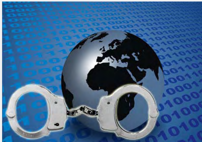
Globalno suzbijanje trgovine ilegalnim narkoticima (Gadgets.ndtv.com)

za borbu protiv međunarodne trgovine ilegalnim narkoticima. U dokumentu su navedena dva prioriteta: borba protiv trgovine kokainom i heroinom. Takođe, pakt može da se koristi i za suzbijanje trgovine ostalih ilegalnih narkotika, pre svega marihuane i sintetičkih droga.