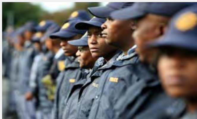
Policija u Južnoj Africi spremna za Svetsko prvenstvo u fudbalu 2010

larijama, te o obaveznosti javne dostupnosti preseka stečenih iskustava i izrade preporuka.