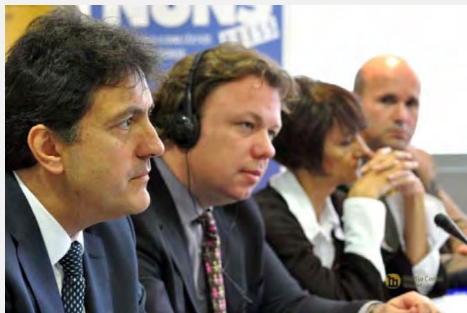
Konferencija u Medija centru

psihološku, psihijatrijsku, medicinsku, pravnu pomoć i edukaciju. Delimično je to urađeno aktivnostima organizacija civilnog društva – Beogradskog centra za ljudska prava, Helsinškog odbora za ljudska prava i IAN, kao i Zaštitnika građana. Aktivnosti su uglavnom odnose na nadgledanje stanja u zatvorima, policijskim stanicama i ustanovama socijalne i zdravstvene zaštite.