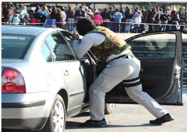
Demonstracija policije u borbu protiv organizovanog kriminala

anje razmene iskustava u borbi protiv korupcije, kao i da države članice Saveta treba sa pridaju veći značaj Regionalnoj antikorupcijskoj inicijativi. Borba i praćenje ilegalnih migracija ulaze u strateške prioritetne oblasti. U okviru ove teme je posebno istaknuta važnost odgovarajućeg sprovođenja sporazuma o readmisiji. U tom pogledu, Srbija bi trebalo da u narednom periodu potpiše sporazume o readmisiji sa Albanijom i Makedonijom, što je od izuzetne važnosti obzirom da najveći broj ilegalnih migranata dolazi preko Grčke na ove prostore. U ovom domenu, od Regionalne inicijative za migracije, azil i izbeglice (MARRI) traži se dalja izgradnja kapaciteta kako bi se državama članicama pružila bolja pomoć u produbljivanju saradnje. Na kraju ističe se da produbljivanje pravosudne i policijske saradnje treba da bude u skladu sa principima zaštite ljudskih prava.