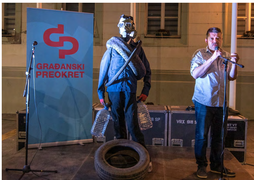
“Smrda – Zrenjaninac iz budućnosti” na glavnom zrenjaninskom trgu leta 2020. godine

Prvi veći javni skup s kojeg je zatražena obustava izgradnje Linglongove fabrike autoguma održan je u Zrenjaninu 21. avgusta 2020. godine, u sklopu inicijative “da smrdovi odu” koju je tokom leta sprovodio Građanski preokret uz podršku Centra za istraživanje, transparentnost i odgovornost (CRTA). 33 Okupljenima se na početku obratio “Smrda, Zrenjaninac iz budućnosti”. U pitanju je bio performans – lutka obučena u autogume, sa zaštitnom (gas) maskom na glavi i balonima s prljavom vodom u rukama. Smrda je naglasio da je vrlo napredan: može da pije otrovnu vodi i udiše otrovan vazduh, da jede plastiku, da živi bez mozga i muda, bez potomaka. Više od 300 građana potpisalo je tom prilikom četiri zahteva od kojih je jedan da se zabrane građevinski radovi Linglongu. Zahtevi su predati gradskoj upravi koja ih je u potpunosti ignorisala. 34