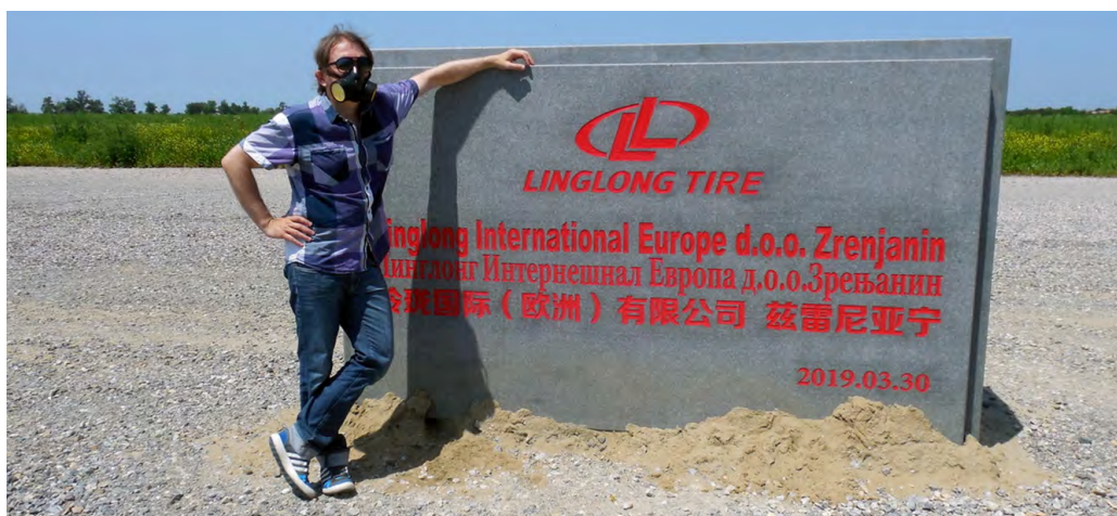
Detalj sa snimanja spota u proleće 2019. – sa zaštitnom maskom pored kamena temeljca Linglonga

Aktivisti su ubrzo započeli i rad na podizanju svesti građana o ovoj važnoj temi, ukazujući na već postojeću, lošu situaciju u pogledu zagađenja, koje će dolaskom Linglonga dostići dramatične razmere. Snimili su spot “napravimo preokret” kojim su ukazali na negativne trendove, s porukom da će Linglong doneti sa sobom i zagađenje i robovski radni odnos, što se dve godine kasnije obistinilo. 5