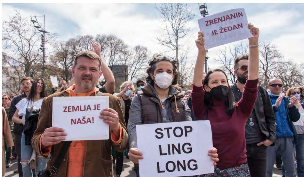
Zrenjanski aktivisti na jednom od mnogobrojnih ekoloških protesta

Kršenje velikog broja propisa, zloupotreba javnih ovlašćenja, ignorisanje građanskih prava i izuzetna popustljivost državne, pokrajinske i lokalne vlasti prema jednom investitoru su dosadašnja iskustva u vezi s kineskom kompanijom Linglong koja gradi ogromnu fabriku autoguma kod Zrenjanina. Tužilaštvo i Upravni sud u dugom vremenskom periodu ignorišu krivične prijave i tužbe u vezi s izgradnjom te fabrike. Javnost u Srbiji je uskraćena za saznanje o tome kako će rad te gumare uticati na životnu sredinu, hranu koja se u njoj proizvodi, obližnji specijalni rezervat prirode "Carska bara" i zdravlje ljudi koji tu žive. Informisanje o tim problemima je otežano jer ih prorežimski mediji ignorišu ili zataškavaju. Monitoring investicije kompanije Linglong i njenih posledica po Zrenjanin i Srbiju tokom prethodne tri godine sistematski sprovode samo građanski aktivisti, uz pomoć nekoliko udruženja i nezavisnih medija.