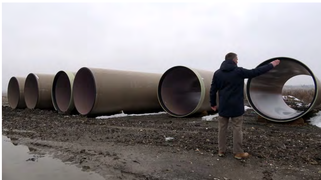
Aktivista NVO Građanski preokret ispred cevi kojima se Linglong spajao s rekom Begej

Stalni monitoring koji sprovode nad Linglongom učinio ih je svojevrsnim reporterima s lica mesta, tako da su mnogi mediji za svoje izveštaje koristili njihove foto i video zapise. Jedan od poslednjih takvih slučajeva dogodio se sredinom decembra 2021. godine kada su zabeležili spajanje buduće fabrike autoguma s rekom Begej cevima velikog prečnika. 55