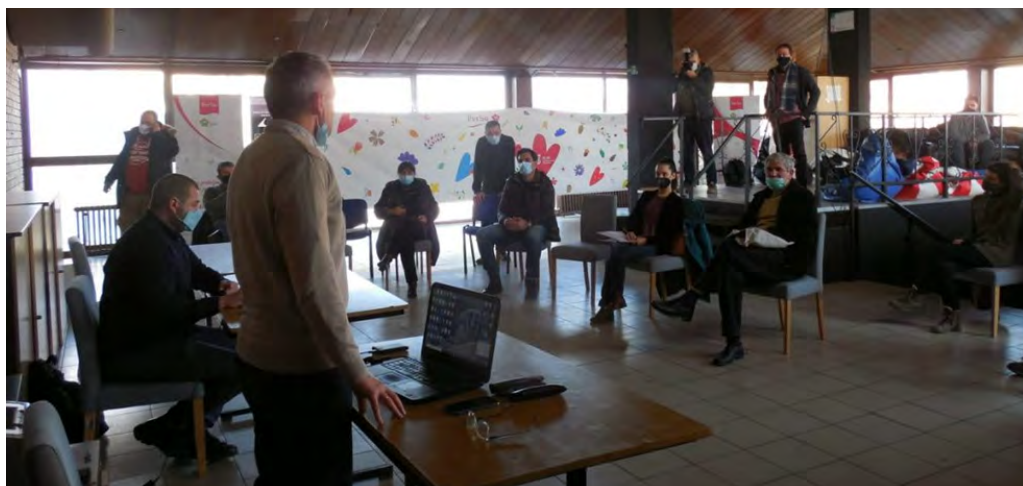
Detalj s radionice o pisanju primedbi na podnetu studiju Linglonga

Uz stručnu podršku Regulatornog instituta za obnovljivu energiju i životnu sredinu (RERI) i logističku pomoć Centra za istraživanje, transparentnost i odgovornost (CRTA), Građanski preokret je organizovao radionicu o učešću u javnoj raspravi i pisanju primedbi i mišljenja na podnetu studiju, a zatim organizovao i prevoz zainteresovanih Zrenjaninaca na javnu raspravu zakazanu u Novom Sadu.