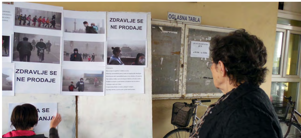
S ulične akcije u Zrenjaninu 1. juna 2019. godine

Već 1. juna, nakon što su prethodno od gradske uprave Zrenjanina i nadležnih resora u AP Vojvodini i Vladi Republike Srbije saznali da studija o proceni uticaja buduće gumare na životnu sredinu ne postoji, 3 aktivisti su sproveli uličnu akciju pod nazivom “Zemlja se ne poklanja – zdravlje se ne prodaje”. 4 Oni su na glavnoj gradskoj pijaci u Zrenjaninu izložili fotografije zagađenih gradova u Kini i podelili flajere na kojima su iznete do tada poznate činjenice o gradnji fabrike automobilskih guma Linglong u Zrenjaninu, bez studije o proceni uticaja na životnu sredinu.