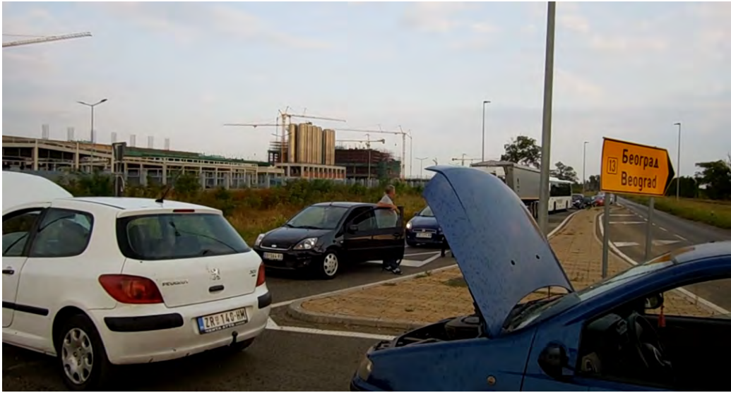
Blokiran magistralni put kod gradilišta Linglonga 24. avgusta 2021. godine