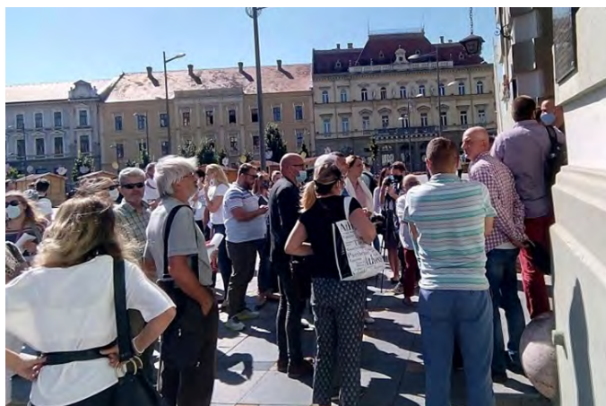
Građani ispred Skupštine grada Zrenjanina i u holu zgrade, sprečeni u nameri da prisustvuju javnoj raspravi

Gradska uprava je uprkos velikom broju negativnih mišljenja na kraju postupka dala saglasnost na studiju, a zakazana javna rasprava se pretvorila u dodatno kršenje propisa. Koristeći protivepidemijske mere kao izgovor, gradska vlast je fizičkim obezbeđenjem, a zatim i intervencijom policije sprečila stotinak građana u nameri da učestvuju u javnoj raspravi. Mesta u sali koja je bila određena za ovaj skup zauzeli su predstavnici investitora, izrađivača studije, tehničke komisije i novinari, dok je za građane, prema kalkulaciji gradske uprave o potrebnoj zdravstvenoj distanci među učesnicima, ostalo šest stolica. Nezadovoljni građani su protestovali što su onemogućeni da učestvuju i ocenili da je javna rasprava pretvorena u farsu. 21