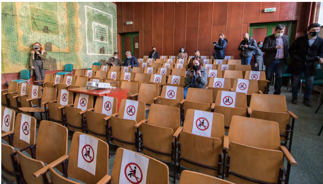
Javna rasprava bez javnosti u Novom Sadu

Javna rasprava 18.02.2021. godine u Novom Sadu je predstavljala svojevrsnu reprizu zrenjaninskog scenarija jer je i pokrajinska vlast, koristeći protivepidemijske mere kao izgovor, nameravala da javnu raspravu sprovede protiv propisa, iz više ciklusa, pred manjim grupama. Pošto je takva forma skupa nezakonita i protivna logici javnih rasprava na kojima svi treba sve da čuju, okupljeni građani su, nakon jednosatnog ubeđivanja s pomoćnikom pokrajinskog sekretara za zaštitu životne sredine Nemanjom Ercegom 26 ostali u protestu ispred Pokrajinskog zavoda za zaštitu prirode, dok se u njemu, u praznoj sali održavala "javna rasprava". 27 Aktivisti su naknadno otišli na pisarnicu pokrajinskih organa i predali podneske kojima se žale zbog uskraćenog prava da učestvuju u javnoj raspravi.