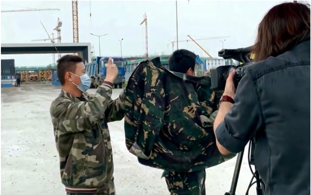
Uniformisani stranci sprečavaju rad novinara na javnom putu u Zrenjaninu

građanskog aktiviste holandskoj televiziji. U sred intervjua, koji je rađen na javnom putu nekoliko stotina metara dalje od gradilišta fabrike, oni su uskočili između kamere i aktiviste. Zatim su širili šatorsko krilo ispred kamere, unosili se u lice novinarima, fotografisali prisutnima lica i registarske tablice vozila. 36 Nekoliko dana kasnije, slično je doživela i ekipa televizije NewsMax Adria. 37 Prema svedočenju pojedinih aktivista, u sprečavanju da se priđe fabrici povremeno je aktivno učestvovala i policija Srbije. 38