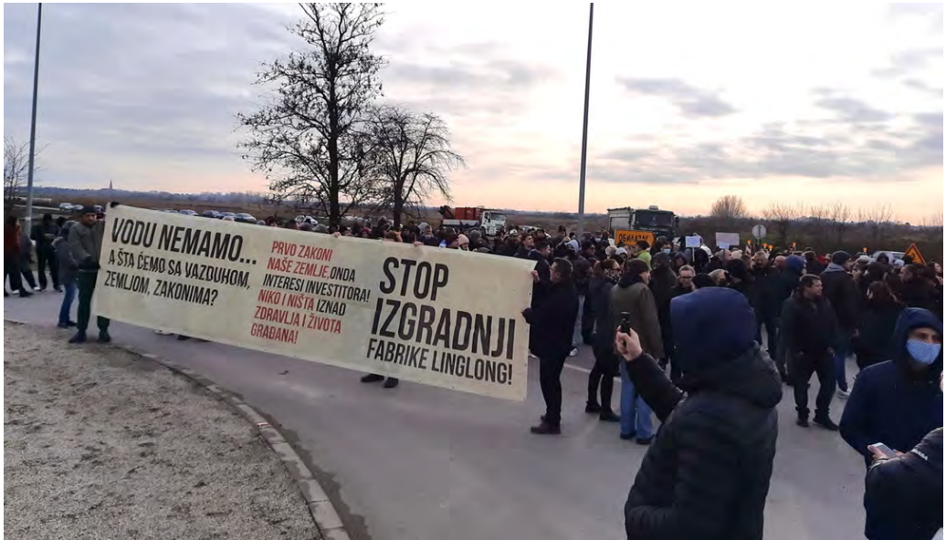
Blokada puta kod Linglonga 4. decembra 2021. godine

Kada su se širom Srbije krajem 2021. godine organizovale blokade saobraćajnica, kao vid građanskog pritiska na vlast od koje se tražilo povlačenje zakona o eksproprijaciji i izmena zakona o referendumu i narodnoj inicijativi, Zrenjaninci su se okupili na najlogičnijem mestu, na magistralnom putu ka Beogradu, kod Linglonga. I taj protest su iskoristili da istaknu zahtev da se obustavi izgradnja fabrike koju smatraju izuzetno štetnom. 47